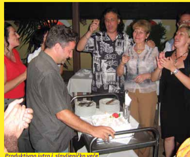
Produktivno jutro i slavljeničko veče