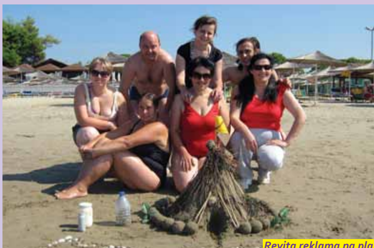
Revita reklama na plaži i trka za biserima u moru

Koliko je „reklama“ bila originalna a zadatak uspešan, govori i veliko interesovanje slučajnih prolaznika na plaži među kojima i menadžerke najveće TV kuće u Albaniji, Top Chanel-a ( sa preko 40 satelitskih TV kanala), koja je kratku reportažu o ovoj reklami na plaži zabeležila svojom kamerom. Slično je bilo i u zadatku sa Revita loptama, kvalifikaciji za ulazak u finale igre u trci do bisera –