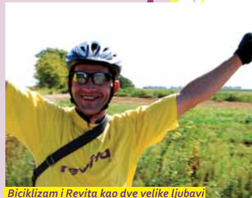
Biciklizam i Revita kao dve velike ljubavi

„Koliko god kilometara da prelazim, napunim svoju Revita flašicu i spremim naručenu količinu Revite do 3 kg. Pijem Revitu redovno jer mi prija, a što se zarade tiče, polako, tek sam pozicija tri, doći će i moje vreme!“