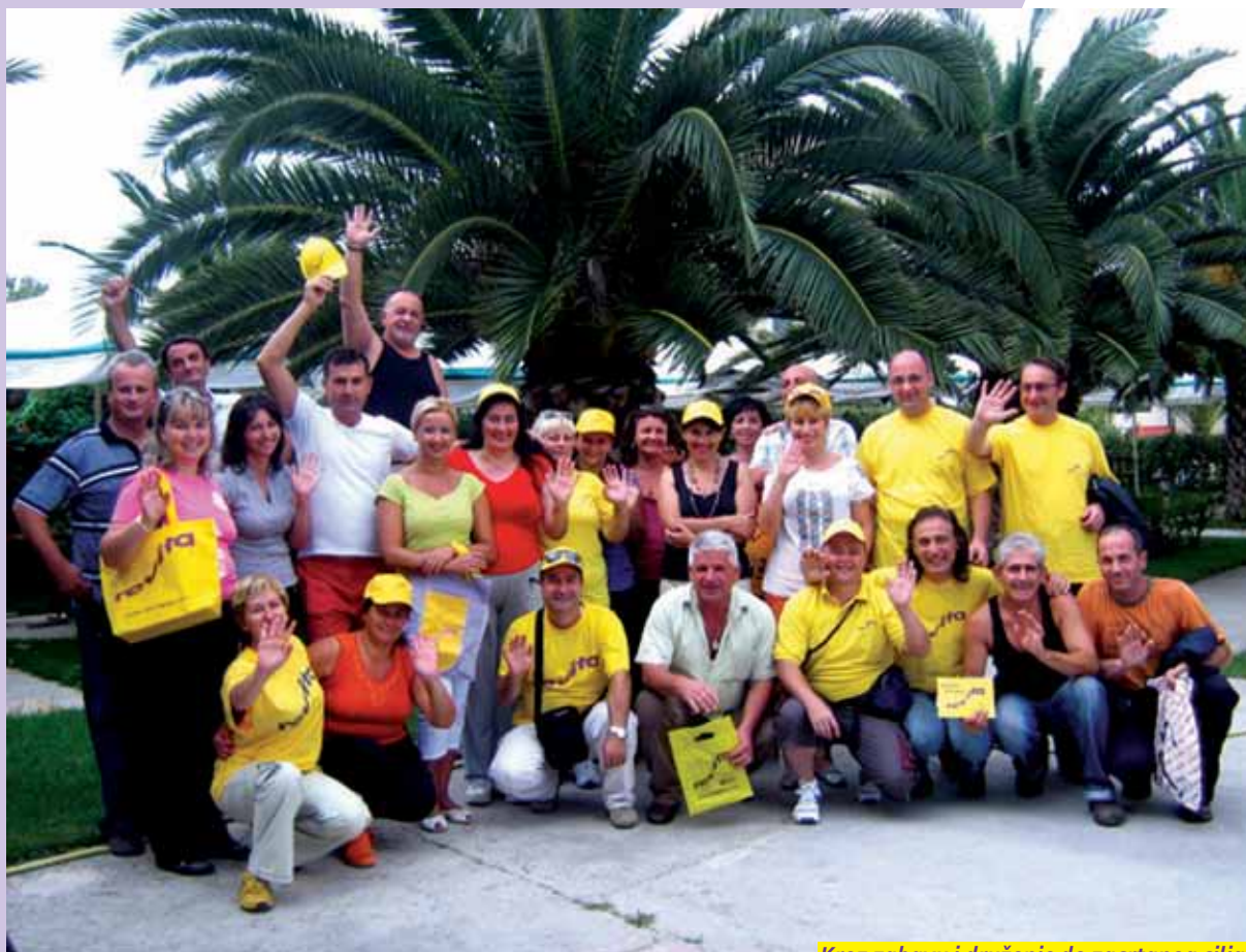
Kroz zabavu i druženje do zacrtanog cilja