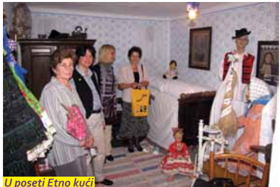
U poseti Etno kući