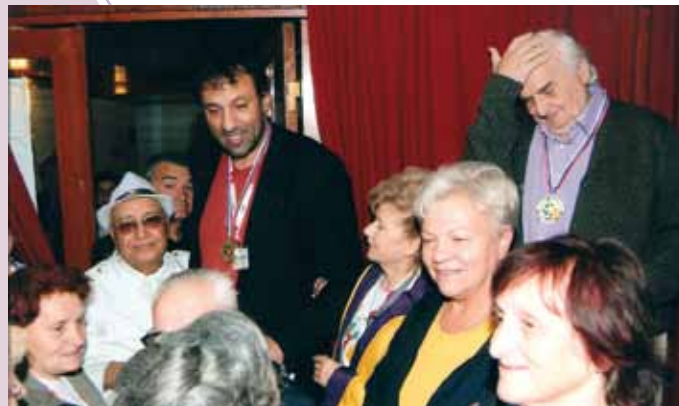
Revitaši na Olimpijadi zajedno sa velikim imenima iz sveta sporta