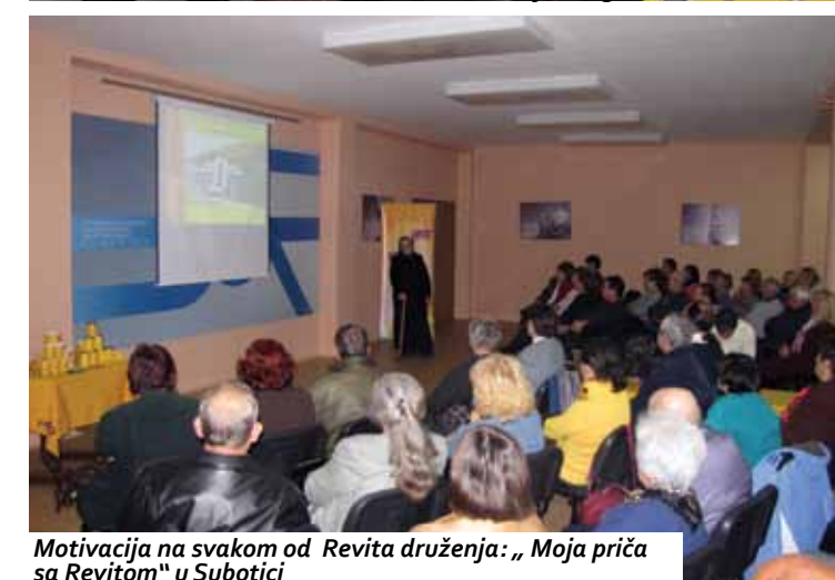
Motivacija na svakom od Revita druženja: „Moja priča sa Revitom“ u Subotici