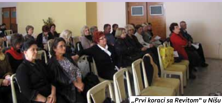
„Prvi koraci sa Revitom“ u Nišu