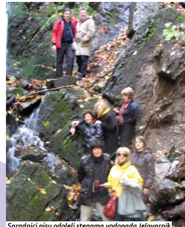
Saradnici nisu odoleli stenama vodopada Jelovarnik