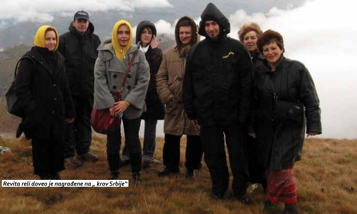
Revita reli doveo je nagrađene na „krov Srbije“