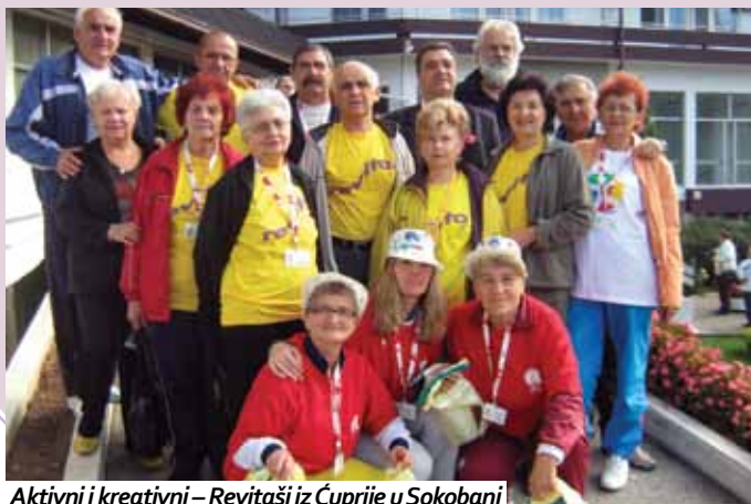
Aktivni i kreativni – Revitaši iz Čuprije u Sokobanji

Osim sportkih takmičenja, stručnih predavanja i kulturno zabavnog programa za slušaoce trećeg doba, organizatori su se pobrinuli da ova manifestacija bude još interesantnija. Učesnici su imali priliku da upoznaju predsednika OK Vlada Divca i šahovskog velemajestora Borisava Ivkovića koji su odgovarali na postavljena pitanja učesnika olimpijade.